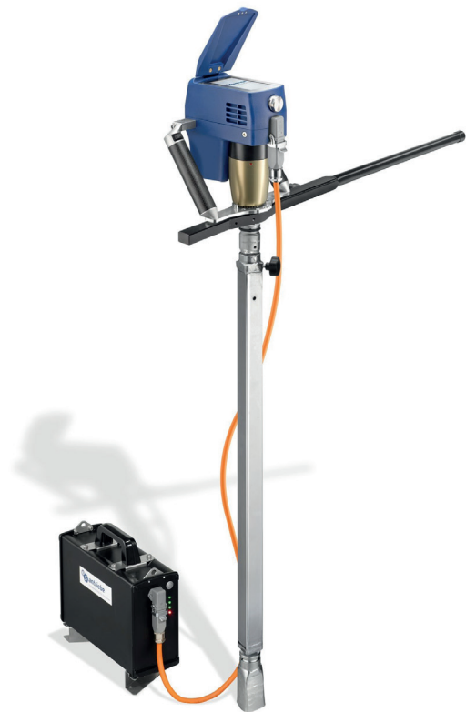
3S AIG mobil XS mit Akkupack und Reaktionsarm